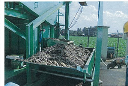
平成 24 年 7 月 19 日 那須野ヶ原発電所 水槽部除塵作業