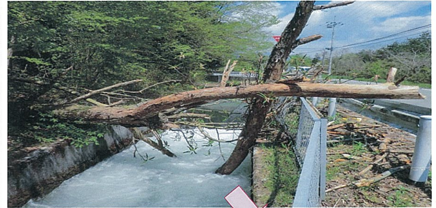
平成 24 年 5 月 7 日 第一分水 (黒磯用水路) 低気圧の影響による強風後のパトロールで発見された倒木

那須野ヶ原土地改良区連合の事業の中でも、施設の維持管理は重要度の高いものです。昨今の異常気象による予測のできない天災、或いは事故等(車の当て逃げなど)による施設の破壊、もしくは施設自身の老朽化による破損・汚損など、定期的な点検やパトロール、整備・補修は地域における水路等の安全を確保なものにするためにも、常に正確に迅速に行わなければなりません。連合職員はもちろんのこと、組合員をはじめ地域ぐるみで施設保全のためのご協力をお願いいたします。