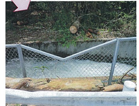
倒木除去後のフェンス破損状況