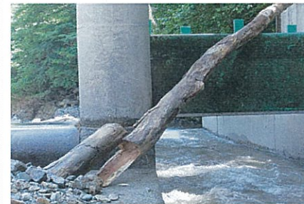
平成 24 年 6 月 26 日 暴沼頭首工 大雨による流木引上げ作業