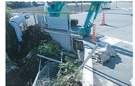
平成 24 年 10 月 29 日 塩野崎用水路 車輛事故によるフェンス崩壊 復旧作業中