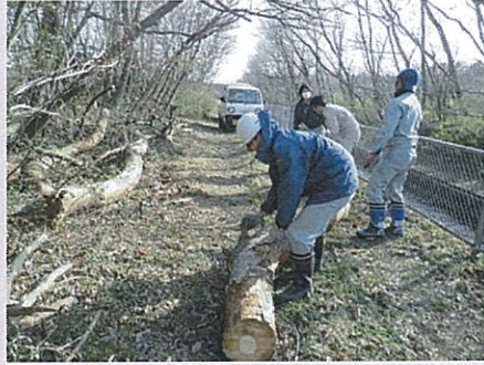
【下段幹線用水路（那須疏水）】平成25年4月8日