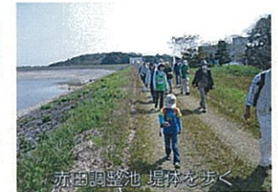
赤田調整池 堤頂部を歩く

今後も他県や地域の方々へ土地改良の歴史や施設の機能などをはじめとする多面的機能や水土里ネット那須野ヶ原の取り組みを周知出来るイベントなどには積極的に参加したいと思います。