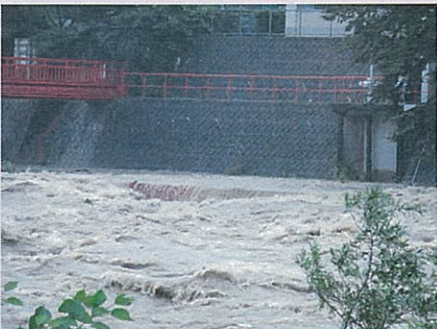
【西岩崎頭首工】平成25年9月16日