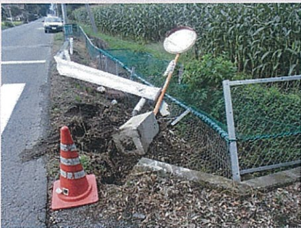
【埼玉用水路】平成25年8月30日