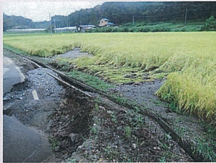
【湯津上連絡水路】平成25年9月9日