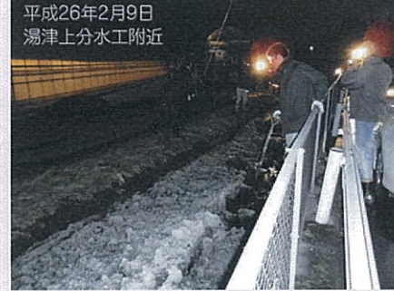
平成26年2月9日 湯津上分水工附近