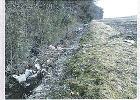
平成26年2月13日 奥沢地区